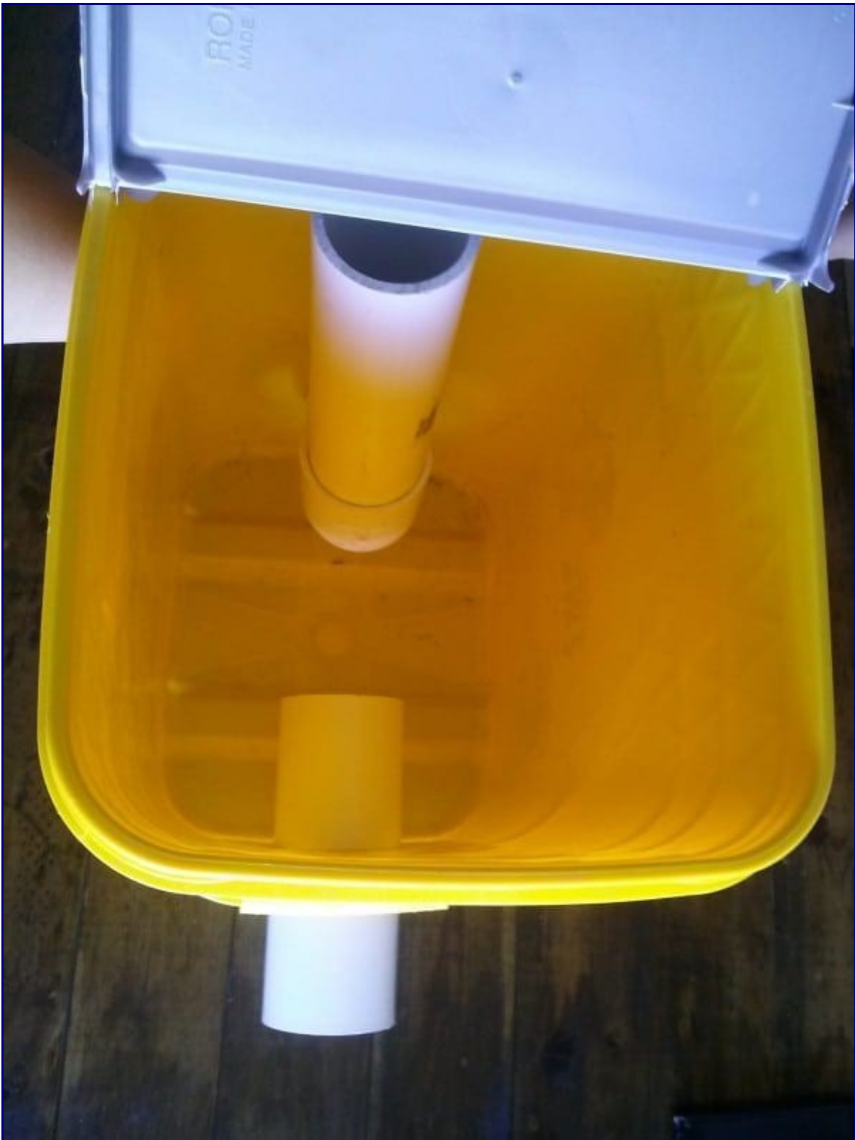
So sieht das Äußere aus